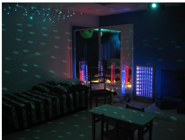
Cabinetul de evaluare și stimulare polisenzorială din cadrul Liceului pentru Deficienți de Vedere, Cluj-Napoca